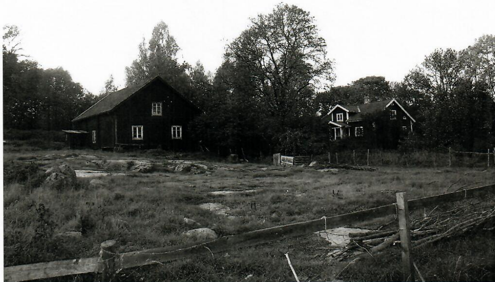
Uthamra gård, oktober 2006.

1975 sålde jag mark på andra sidan Vallentunasjön vid Uthamrahöjden. För pengarna har jag förbättrat flygelbyggnaden, brygghuset, visthusboden och målat tak och väggar på lidret och ladugården. År 2006 har jag låtit måla bostadshuset. En grannfamilj har tagit hand om stallet och satt det i stånd för sina hästar.