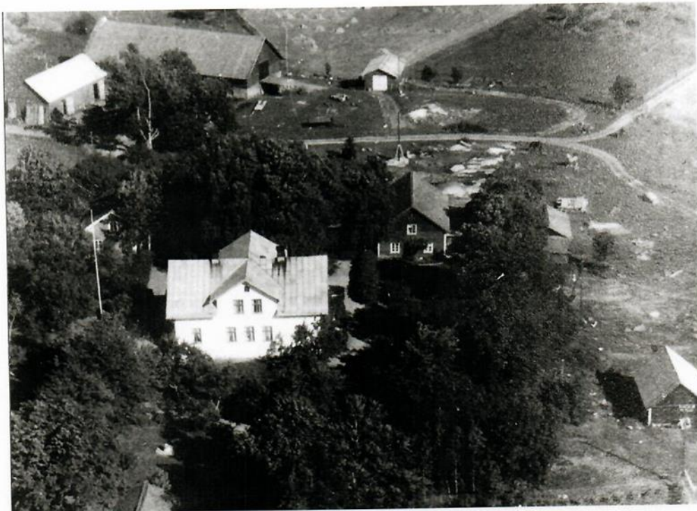
Uthamra gård sedd mot öster. Bilden är från 1940-talet.

Ladugården byggdes 1898 i natursten med tjocka murar. Enligt ett arrendekontrakt från 1909 rymde det 28 kor och fyra svin. Stallet i den södra delen hade plats för sju hästar och två par oxar. Dubbelportar finns både till ladugårdsdelen och till stallet. Ovanpå fanns en höskulle med väggar av liggande grova plank, så kallade skiftesverk. Här förvarades hö till djuren. Hela byggnaden är ungefär 34 meter lång och 12 meter bred. Höskullen har två portar, en på varje gavel. Den södra än inkörspart och en bro leder upp till den. Taket var lagt med spån men ersattes med tegel och senare med plåt. År 2006 har en ny elinstallation gjorts.