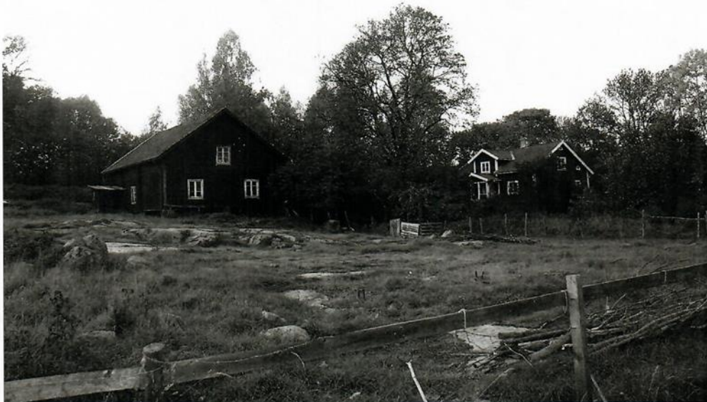
Uthamra gård, oktober 2006.

1975 sålde jag mark på andra sidan Vallentunasjön vid Uthamrahöjden. För pengarna har jag förbättrat flygelbyggnaden, brygghuset, visthusboden och målat tak och väggar på lidret och ladugården. År 2006 har jag låtit måla bostadshuset. En grannfamilj har tagit hand om stallet och satt det i stånd för sina hästar.